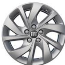
Jante alliage 17" grise