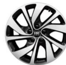
Jante alliage 17" diamantée