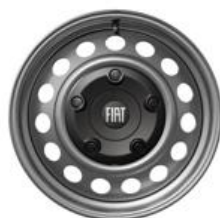
Jante tôle grise 17"