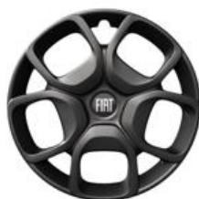
Jante tôle noire 17" avec enjoliveur